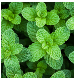
Mentha x piperita