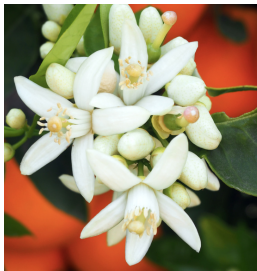
Citrus aurantium var. amara