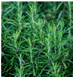
Salvia rosmarinus ct. camphor